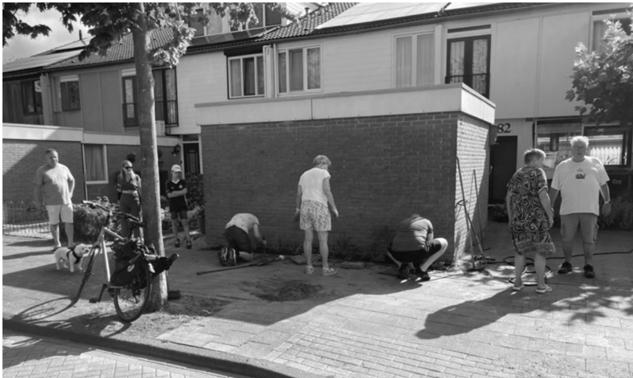
Vergroenen Genderbeemd - aanleg geveltuinen, lees verder op pagina 11 en 12