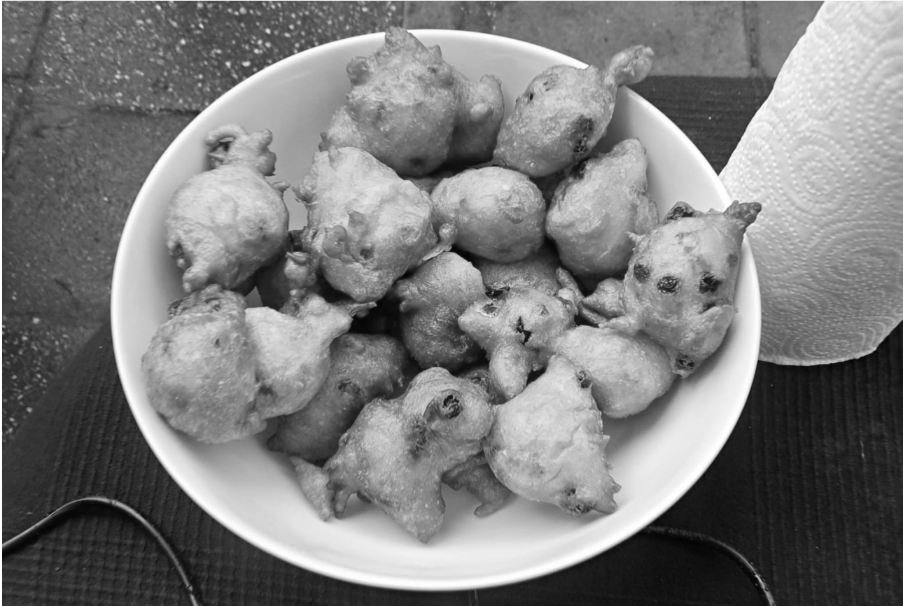
Oliebollen bakken, lees verder op pagina 8